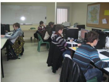
Salles Multimédia équipées en réseau